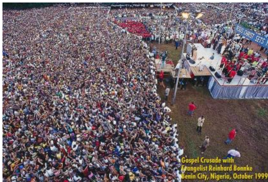
Gospel Crusade with Evangelist Reinhard Bonnke Benin City, Nigeria, October 1999

de Apocalipsis. Doce indica la perfección de gobierno, el servicio, la potestad y la protección, una característica de un sistema perfecto de gobierno. Jesús escogió doce apóstoles fueron los dirigentes y gobernantes de la Iglesia primitiva.